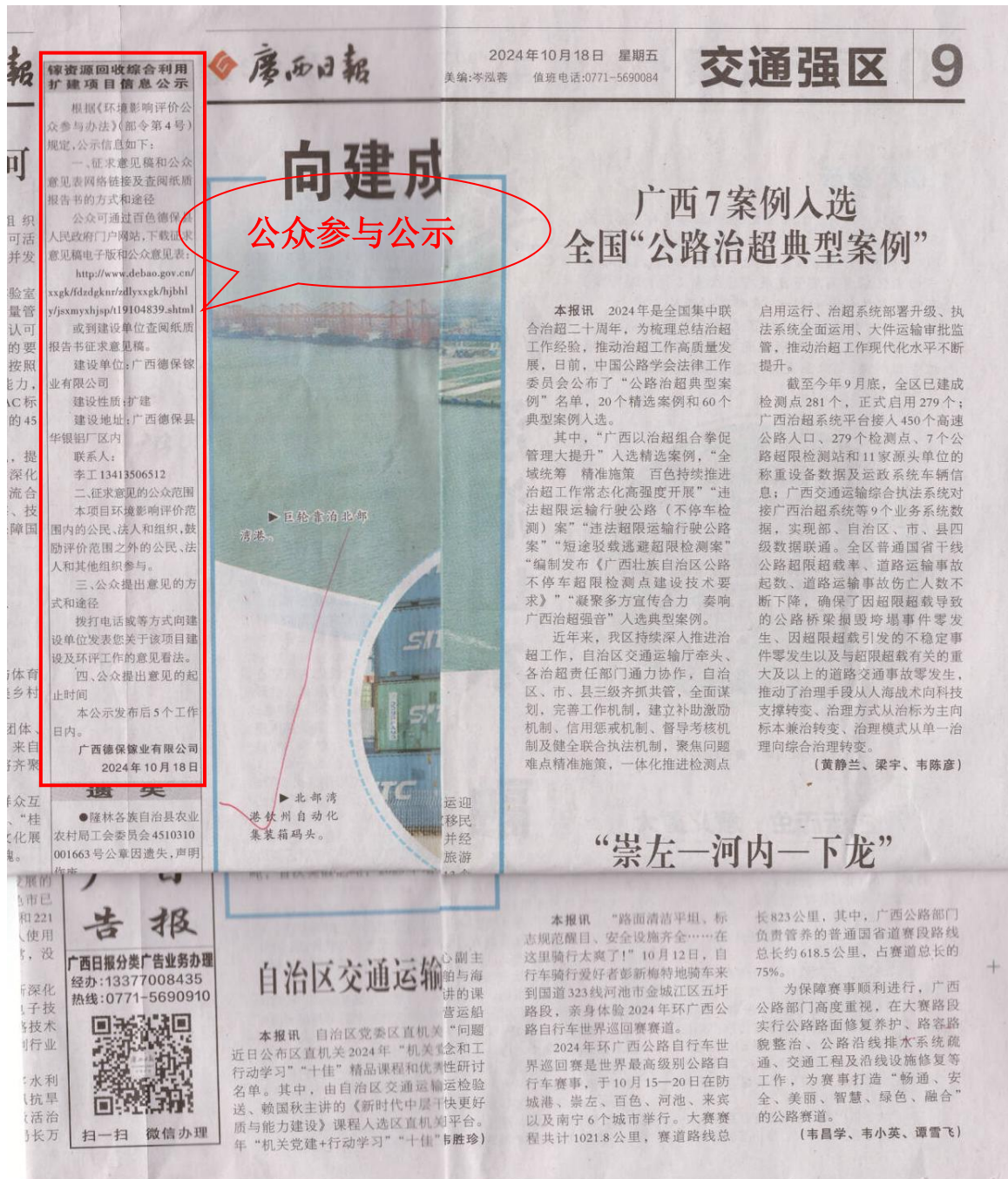
图 3.2-2 2024 年 10 月 18 日《广西日报》刊登信息照片 1

广西日报为建设项目所在地公众易于接触的报纸，载体选取符合《环境影响评价公众参与办法》要求。