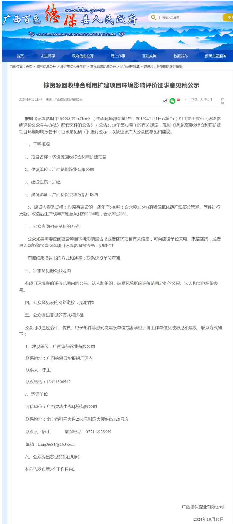
图 3.2-1 征求意见稿公示网页截图