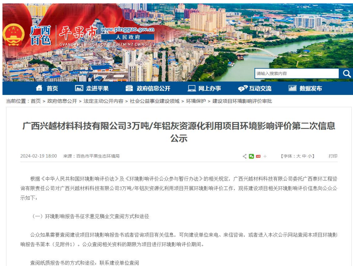
图2 项目环境影响评价第二次公示（网站截图）