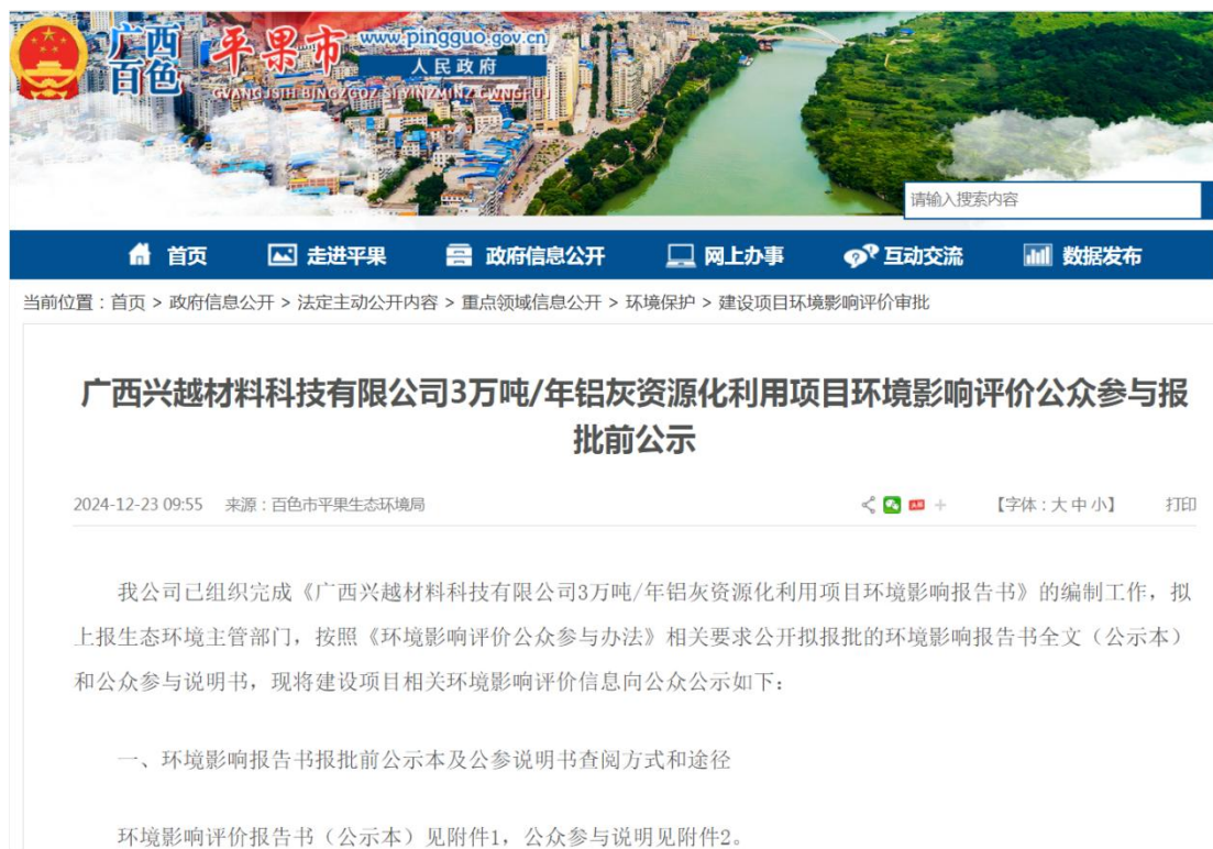
图 5 项目环境影响评价报批前公示（网站截图）

http://www.pingguo.gov.cn/xxgk/fdzdgknr/zdlyxxgk/hjbh/jsxmhjyxpjsp/t19455558.shtml