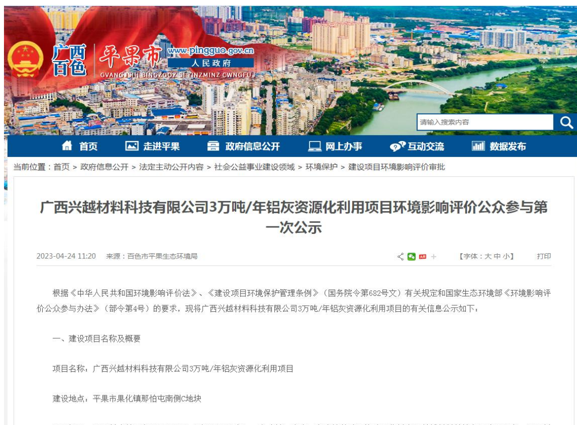
图 1 项目环境影响评价第一次公示（网站截图）